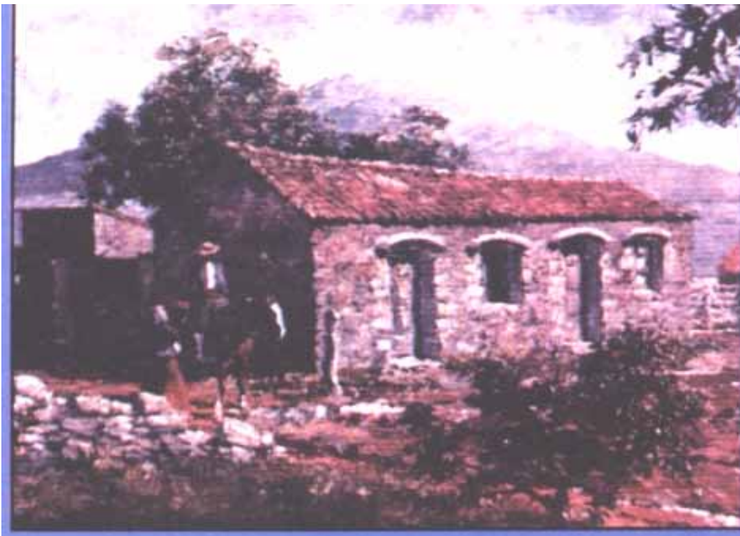
FOTO DE LA CASA DE ARTIGAS